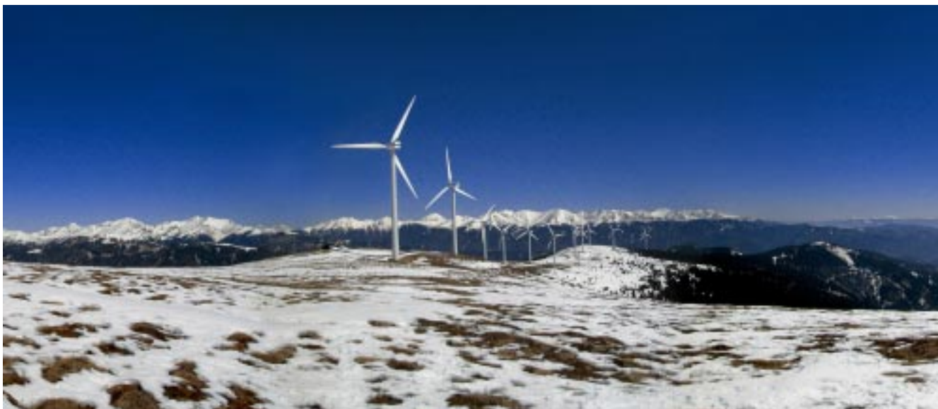
Tauernwindpark Oberzeiring (Österreich) im März.