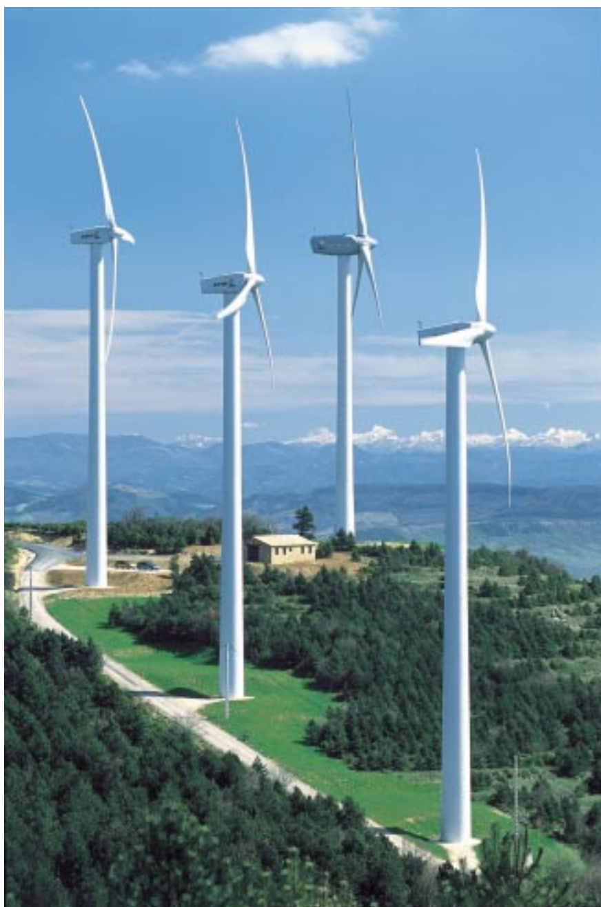
Windpark Aizkibel (Spanien).

In den USA konnten nach einer Flaute im Jahr 2002 (494 MW) wieder Neuinstallationen von 1687 MW verzeichnet werden. Auch Asien erlebte eine Steigerung von 89% im Vergleich zum Vorjahr. Die neu installierte Leistung stieg von 424 MW auf 804 MW. In den anderen Kontinenten ist die Leistung aus Windenergieanlagen um 175 MW auf 605 MW angewachsen. So haben z.B. Australien und Neuseeland ihre Kapazitäten um insgesamt 70 MW auf 294 MW und Nordafrika um 63 MW auf 211 MW erhöht.