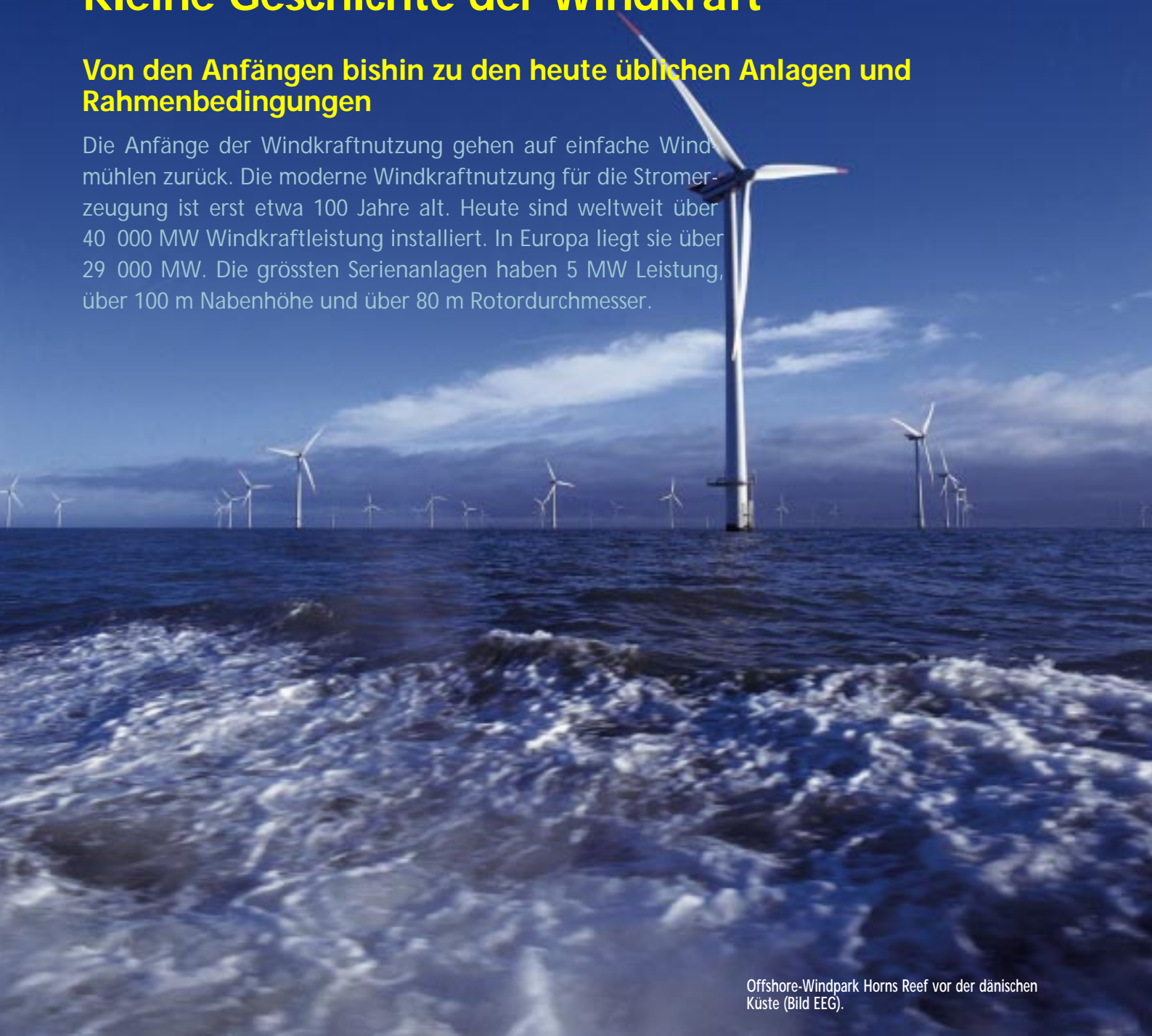
Offshore-Windpark Horns Reef vor der dänischen Küste.

Die Anfänge der Windkraftnutzung gehen auf einfache Windmühlen zurück. Die moderne Windkraftnutzung für die Stromerzeugung ist erst etwa 100 Jahre alt. Heute sind weltweit über 40 000 MW Windkraftleistung installiert. In Europa liegt sie über 29 000 MW. Die grössten Serienanlagen haben 5 MW Leistung, über 100 m Nabenhöhe und über 80 m Rotordurchmesser.